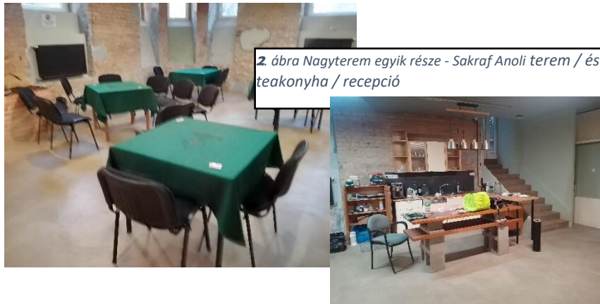
3. ábra Nagyterem különböző részei